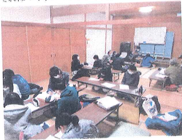
写真：竹園教室・中学生クラスの学習風景