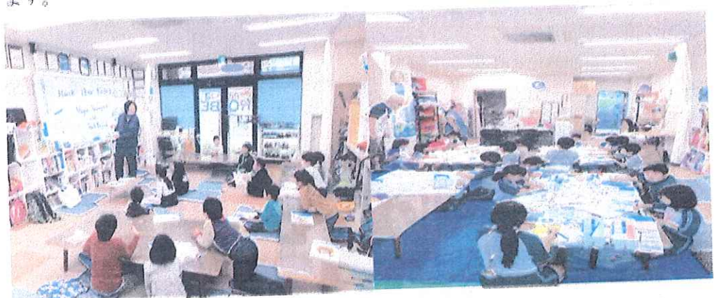
↑ 筑波大英語講師による English Time ↑ ↑ 海外芸術大出身講師の図画工作 Time ↑

① 学童クラブの運営事業 ② 児童福祉法に基づく障害を持つ児童等の保育及び学習支援事業 今年も、学童保育の最中にプログラム (国語算数塾 Time・English Time・書道 Time・図工 Time) を開催しました。国語算数塾 Time では、できなかったことが段々できるようになり、学校での学習もスムーズに行ったり、学校の授業よりも先取りをしている児童の方が、増えてきました。English Time では 英語が楽しくなって、さらに英語教室に通ったり、大きな声で歌ったり、書いたりしました。ご家庭では、大人でもよくわからないような知っている単語を保護者に披露して発音の良さに保護者も驚いたというお話も伺っています。書道は、とても綺麗な字を書くだけでなく、普段ざわざわしている施設内で、『静と動』の時間である『静』の時間として、集中力を高めることができました。学校で、習字を表彰されたという子も今年もいて、成果が出ているのではないかと思います。図工は、毎回、講師が準備した課題をひとつづつこなしていきました。また、図工も学校で賞状ももらったという子もいました。プログラムを実施することで、子供達に色々な方面から、日々、コツコツ行うことの大切さ、それによって得られる自己肯定感、達成感など、出てきているかと思えます。