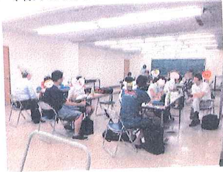
写真：谷田部教室・中学生クラスの学習風景