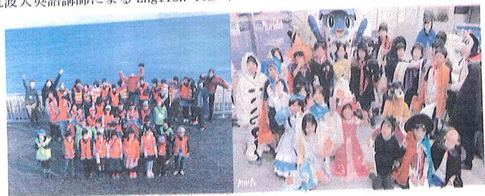
↑ 遠足で日立のかみね動物園 ↑ ↑ ハッピーハロウィン！！